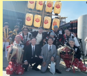
霜月祭で鴨の宮若集会の皆様と！