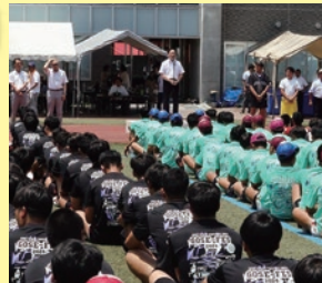
御所ラグビーフェスティバルに参加